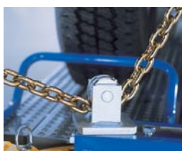
Avec la poulie de retenue D91, les tractions vers le bas sont simples et rapides.

Avec le Bench Rack, le travail est rapidement effectué, de la mise en place du véhicule au contrôle final de la réparation.