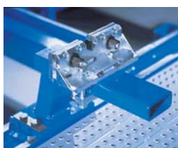
Les pinces de bas de caisse universelles de Car-o-liner offrent un maintien sûr.

Avec la possibilité de choisir entre différents modèles, le Car-o-liner Bench Rack permet de répondre aux besoins individuels de chaque atelier de réparation. Le Bench Rack est équipé d'un système d'inclinaison révolutionnaire facilitant la mise en place du véhicule et permettant de réduire l'espace minimal nécessaire dans l'atelier.