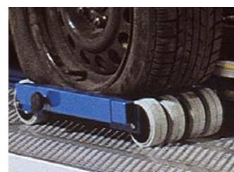
Le chariot de transport facilite la mise en place de véhicules non-roulants sur le banc. Il peut également être utilisé comme frein en le retournant.