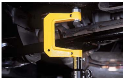
Pratique, le M 217 vous permet d'atteindre les points de mesures les plus difficiles.