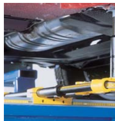
D'un seul coup d'oeil, contrôle des 3 dimensions.