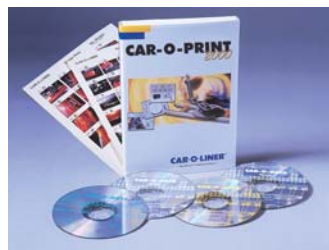
Le logiciel d'installation CAR O PRINT 2000, couplé au CAR O DATA vous offre toutes les fiches techniques de mesure. L'application vous permet de « cibler » le point de mesure correct.