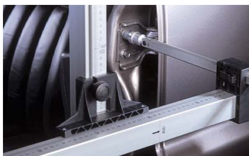
La mesure des points hauts facilement accessibles grâce au système M 900.