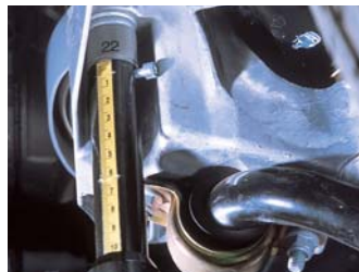
Tubes, pignes gradués et douilles pour contrôler les points de supports mécaniques, même les plus inaccessibles.